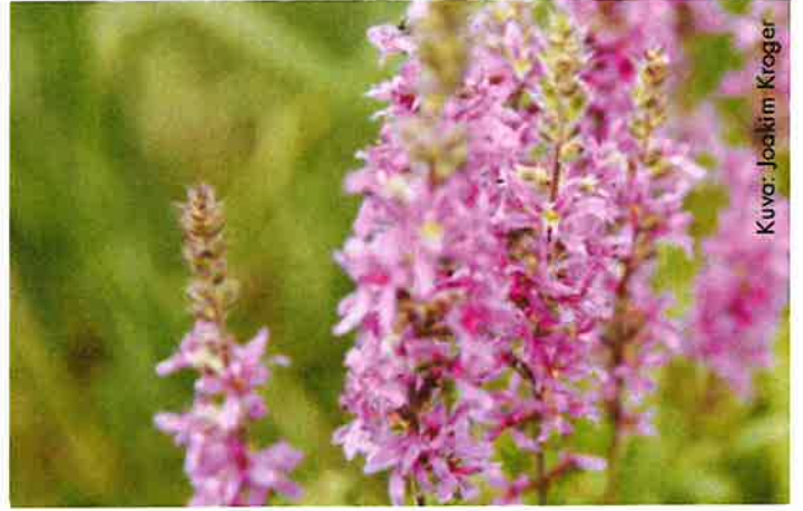
Kuva: Jookim Kroger